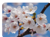
村の木 「さくら」 Village Tree "Cherry tree"