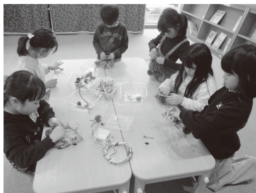
木の实を飾って、素敵なリースが完成