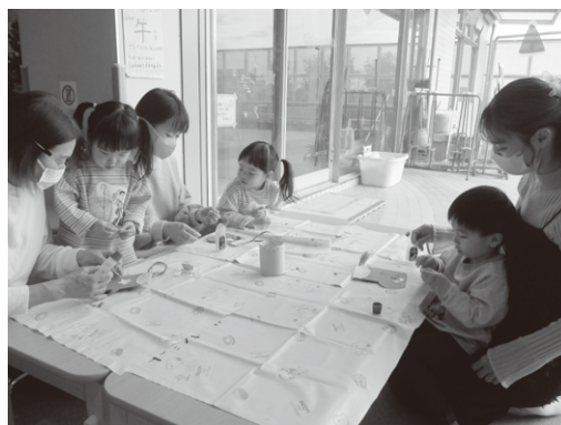
おうちの方と一緒にブーツ作り