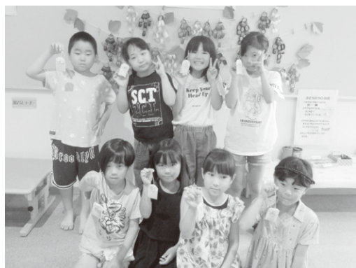
みんなでお守りを作ったよ☆