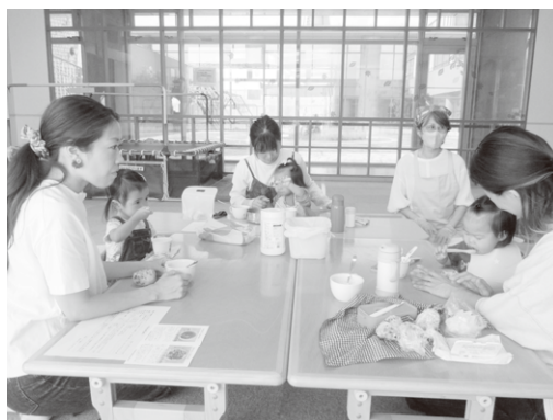
みんなでお昼ごはん♪楽しいね♪