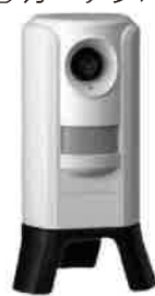
ガーデンバリアⅢ 【充電式】