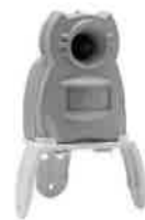
ガーデンバリアミニ 【単2形乾電池4本】