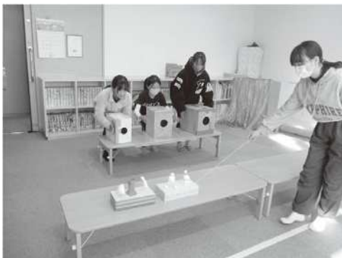
小学生イベント「空気砲であそぼう」