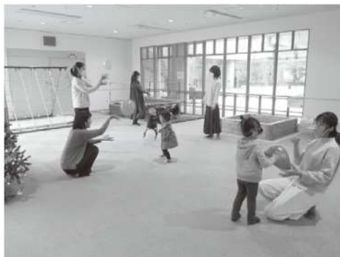
2歳児イベント「風せんあそびをしよう」