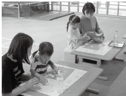
「なぞときゲーム!」考え中… じどうかんであそぼ!「小麦粉粘土あそび」