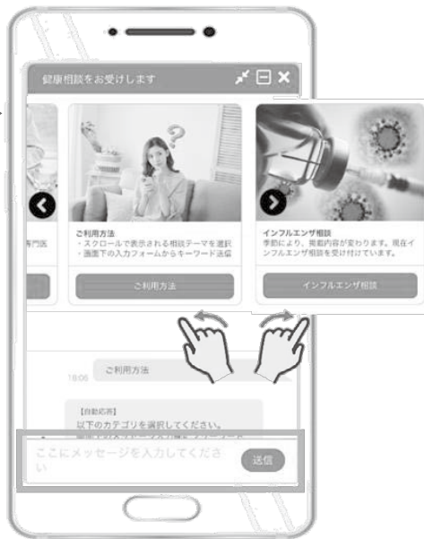
※実際の画面とは異なる場合があります