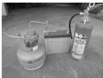
服岡投棄場に持ち込めない処理困難物の例 左から ガスボンベ・バッテリー・消火器