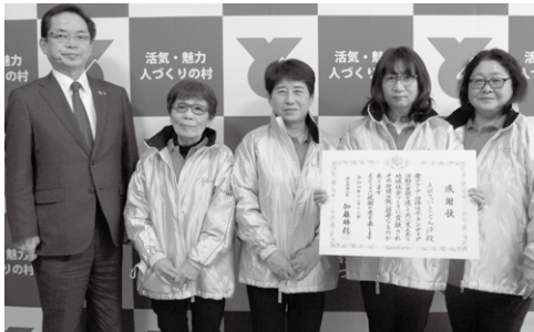
厚生労働大臣感謝状