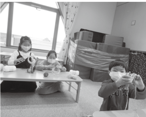
リリアンで小物作り