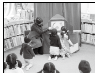
(写真は前回(令和元年度)開催の様子)

(※事業は状況により延期・中止となる場合がありますので、図書館ホームページ等をご確認ください。)