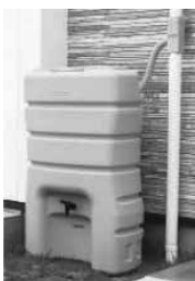
雨水貯留タンクの例