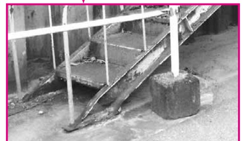
撤去予定階段(南側)