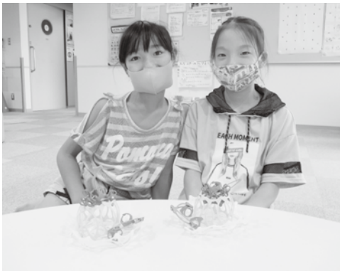
ワミーで作ったよ!