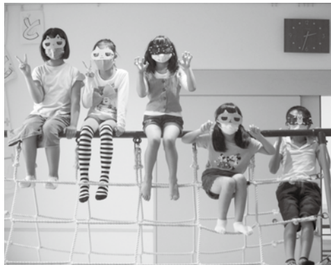
ハロウィンサングラス