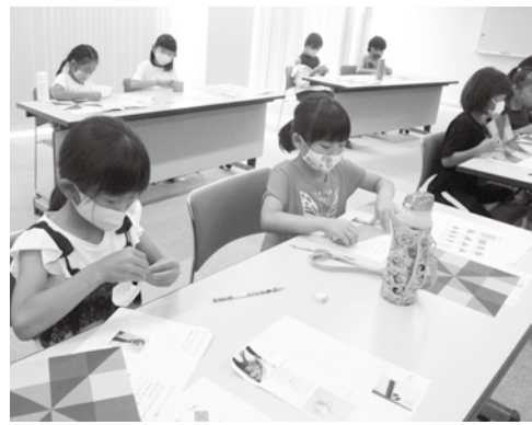
めざせ!子ども福祉大使