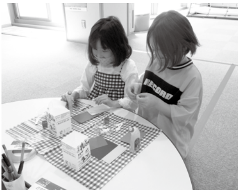
によろによろおばけを作ろう