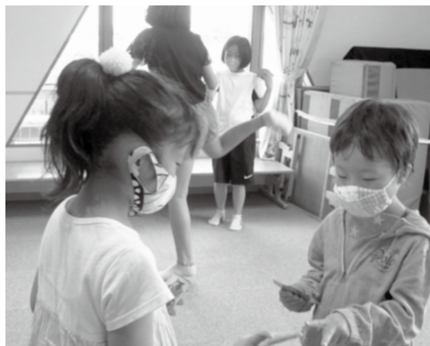
入学・進級の集い