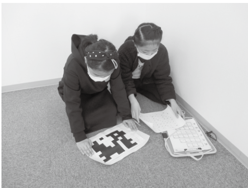
第2回なぞときゲーム