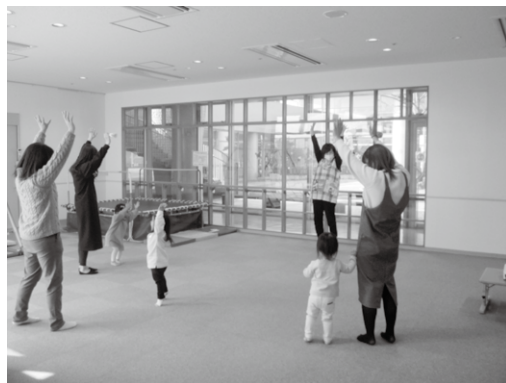
小さい子も遊びに来てね