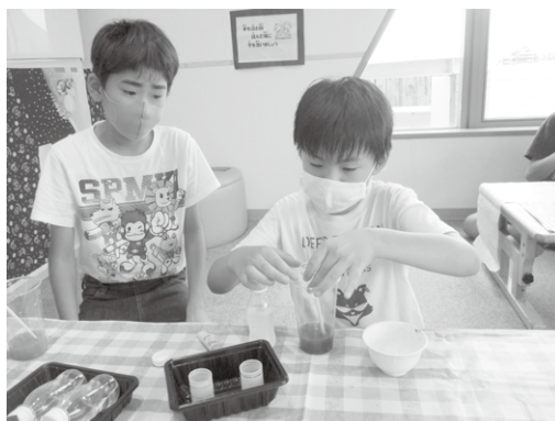
スライムで遊ぼう