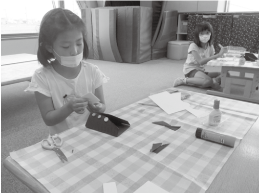
父の日プレゼント作り