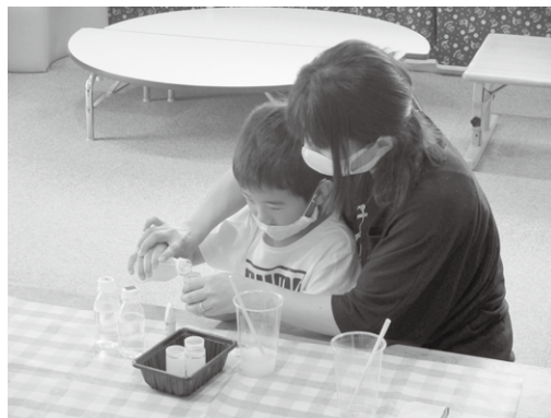
おやこであそぼ!「スライムであそぼう」