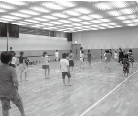
わくわくチャレンジ(ドッチボール)

小・中学生が来館できない間は全てのイベントを中止します。状況によりますので、村公式ホームページなどをご確認ください。