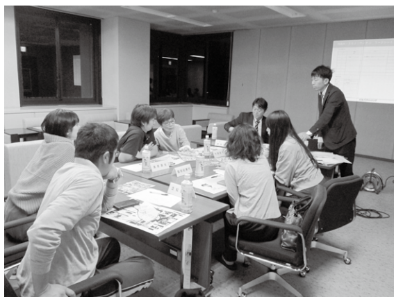
↑プロジェクトチーム会議で検討