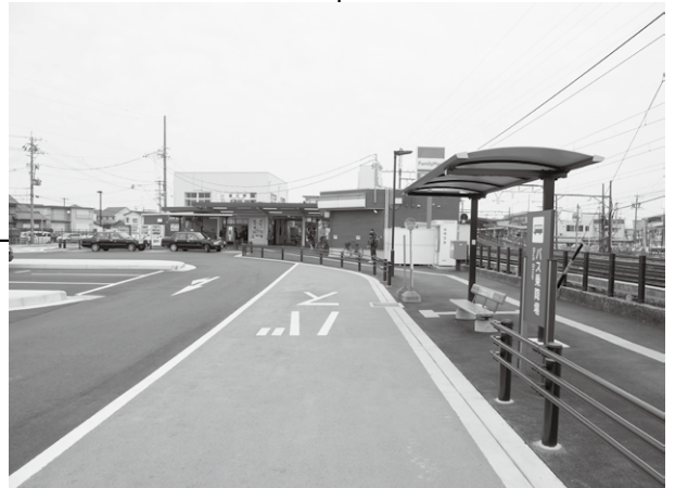
バス停西側から撮影 (カメラ矢印の方向)