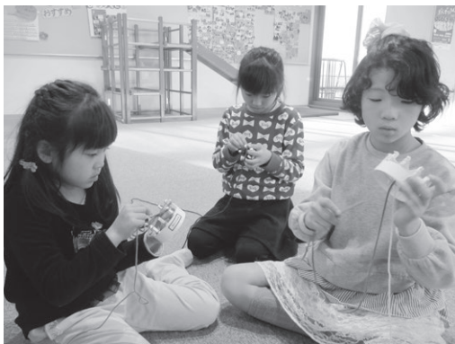
リリアンをつくろう