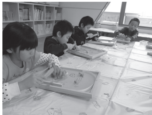
木工遊びをしよう