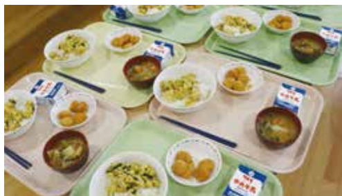
飛鳥学園 給食 玉ネギを使用した親子丼