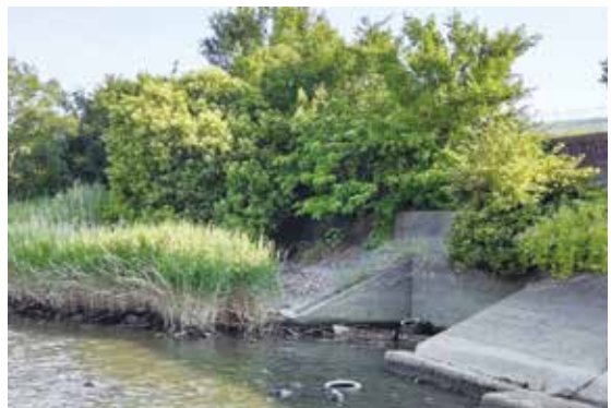
日光川堤防の雑木

他にも老朽化の箇所が 見受けられることから愛 知県に対し、継続的に要 望してまいります。