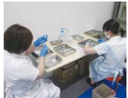
新型コロナワクチン接種の様子