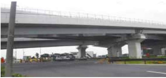
信号機設置予定箇所 (梅之郷)

また、現在愛知県公安委員会と協議中である梅之郷神社付近の信号機の設置については、年内に予定している国道302号の接道整備が完了したら信号機が設置されることを確認しています。