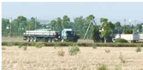
古台ソフトボール場の横に停車しているトラック

土日でも、人っ子1人いない服岡緑地（ピラミッド公園）。平日の日中では隣接道路が、トラックや営業車両の休憩所と化している状況であるが、どのような対策を講じているのか、村としてこのまま朽ち果てるのを待っているのか伺いたい。