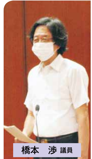
橋本 渉 議員