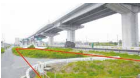
梅之郷地区避難所建設予定地