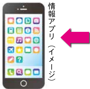
情報アプリ（イメージ）