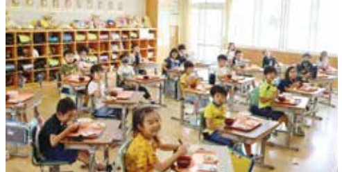
飛鳥学園 給食の様子

児童1人2万円を給付した子育て世帯臨時特別給付金支給事業、65歳以上に商品券1万円分を配付した高齢者生活応援事業などがあります。