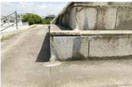
服岡緑地(ピラミッド公園)