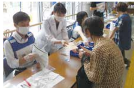
新型コロナワクチン接種の様子