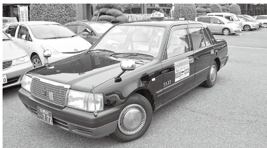
飛島乗合タクシー

新たな便の設定については、利用者数の状況を見極めた上で、飛島村地域公共交通活性化再生法定協議会の中で審議を賜りたいと考えています。