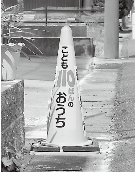
「こども110ばんのおうち」の目印

防犯カメラを50台設置され、犯罪の抑止になって いると考えますが、 一度子どもたちの通学時の安全確保を考えられることを望みます。 同報無線による地域住民への見守りの要請、見守り隊をつくるなど方策を立てられたらと考えますが、村の考えをお答えください。