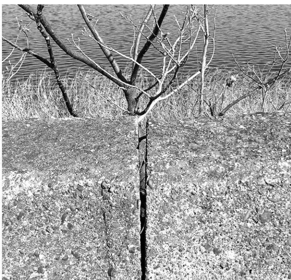
日光川堤防の切れ目