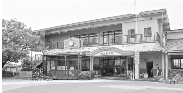
10月より保育料無償化スタート

理由は、学校給食や、他の社会保障分野においても、食事は自己負担が原則であること、食事は子どもが自宅に居ても、日常生活で生じる必然のことであることを踏まえています。