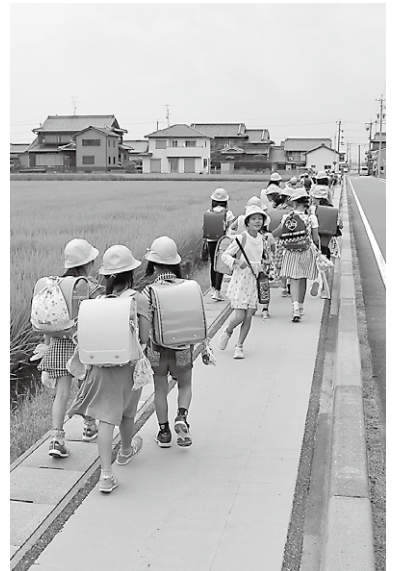
通学児童の安全対策を

県営地盤沈下対策事業ほか2事業にて排水路の整備と飛鳥第1排水機場の更新を順次、愛知県に行っていたいただいています。