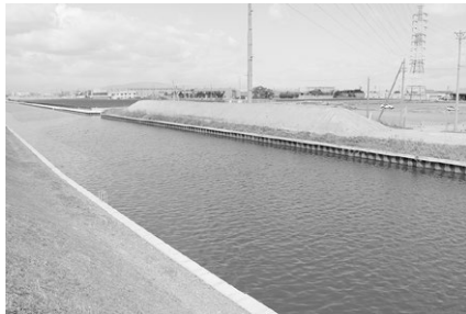
工事で発生した残土

答 国土交通省・ネクスク等が進めている名古屋環状2号線の工事から発生した残土を仮置きで置いている。今後飛鳥村が発注する工事で利用できれば利用する。