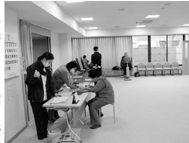
敬老センター運動実践室