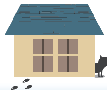
不審者(動物)の侵入