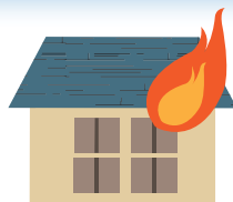
放火による火事・火災