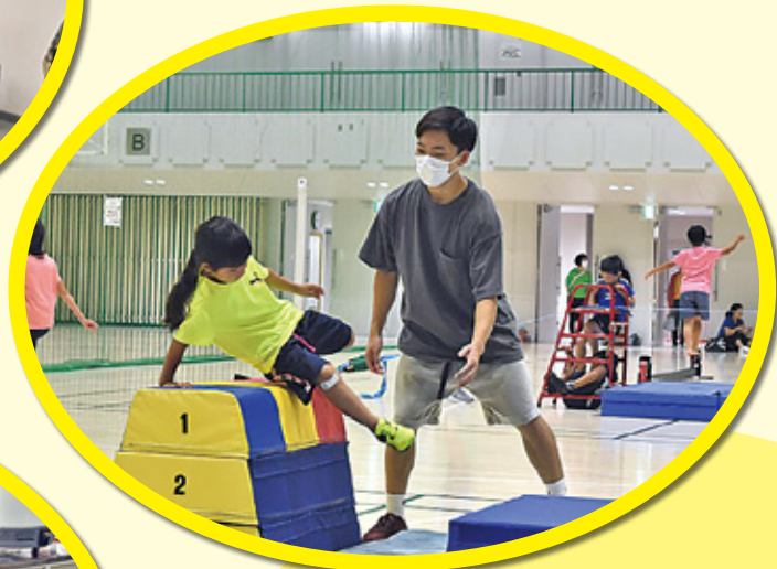
ライフロングスポーツプログラム (パルクール)