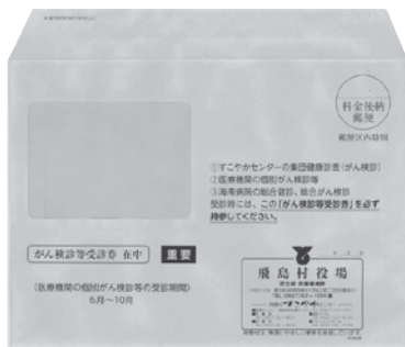
がん検診等受診券封筒(水色)

※国民健康保険または後期高齢者医療制度に加入している方は、特定健診・後期高齢者医療健診の受診券の封筒(黄色)にがん検診等受診券が同封されています。