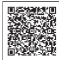
村公式ホームページ 「医療機関で受けられる健診(検診)」