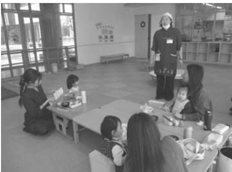
らんらんランチ じどうかんで親子ランチの日