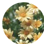
飛島村の木「さくら」 飛島村の花「きく」