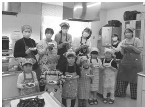
おやこであそぼ キッキング おいしくできました～!