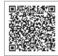
村公式ホームページ 「健康福祉祭出展者の募集」