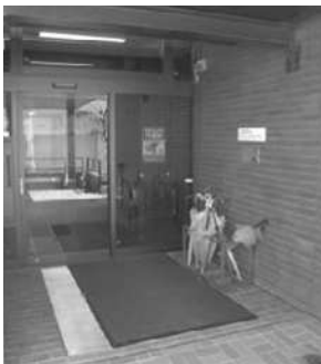
休日・夜間窓口(役場西側玄関)

引き続き、戸籍の届出等については開庁時間外であっても、休日・夜間窓口で対応します。