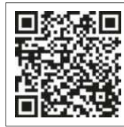
あいち電子 申請システム