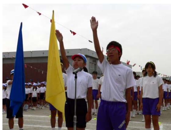
小・中学校合同運動会