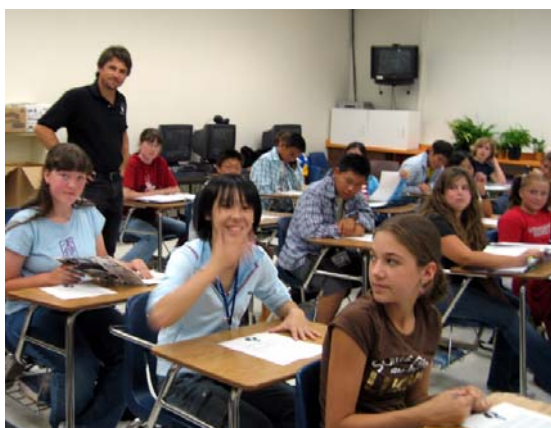
海外派遣研修（米；ブリタンスクール）