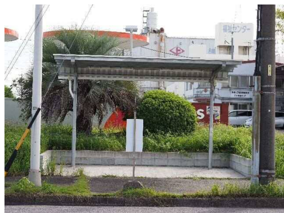
【西部税関南に設置した同タイプ屋根】