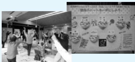
飛島いきいきクラブでもチャレンジデーに参加