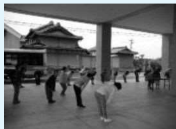
みんなでラジオ体操(新政成一時避難所)