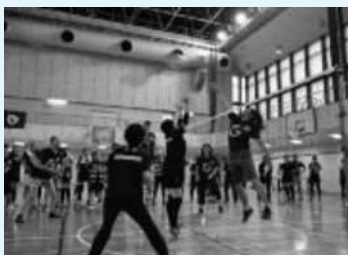
ビーチボール交流会