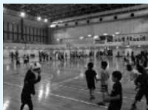
ドッジボールイベント