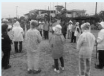
雨にも負けず・・・グランドゴルフ交流会開催!