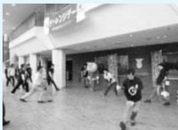
オープニングイベント