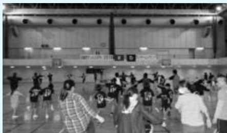
フィナーレイベント

当日は吉本興業の芸人3組もチャレンジデーに参加し、イベントを盛り上げていただきました。