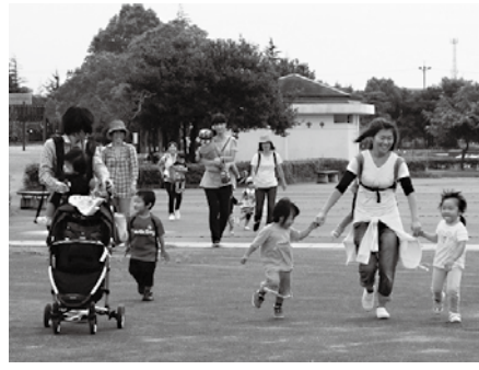
海南子どもの国へ行ったよ!