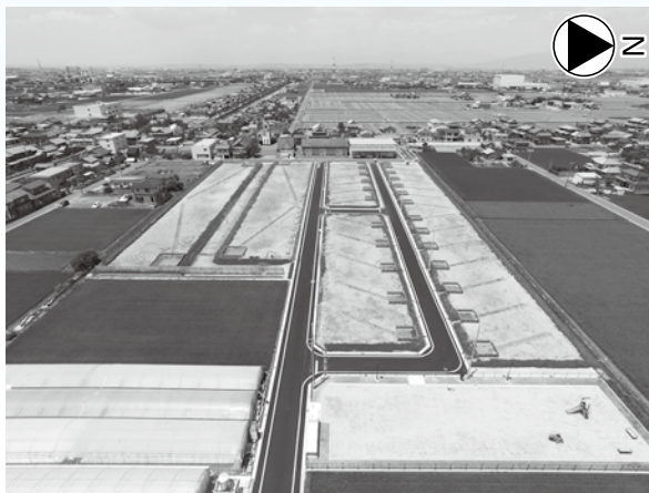
計画地東からの写真(7月1日撮影)

計画地北側の敷地内への上下水道引込工事、道路舗装及び公園の整備工事は一部を除き終了しました。