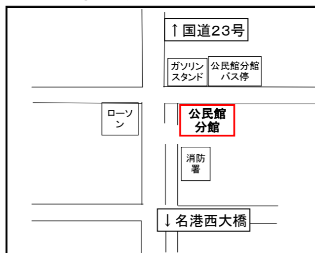
【公民館分館】 飛島村木場二丁目3番地