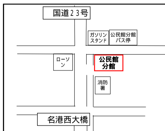
【公民館分館】 飛島村木場二丁目3番地