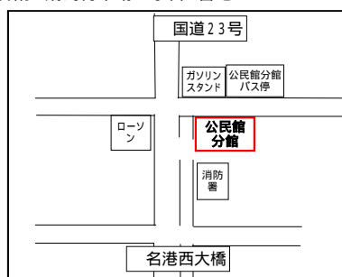
【公民館分館】 飛島村木場二丁目3番地