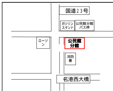
【公民館分館】 飛島村木場二丁目3番地