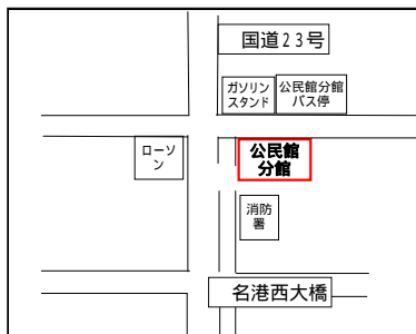
【公民館分館】 飛島村木場二丁目3番地