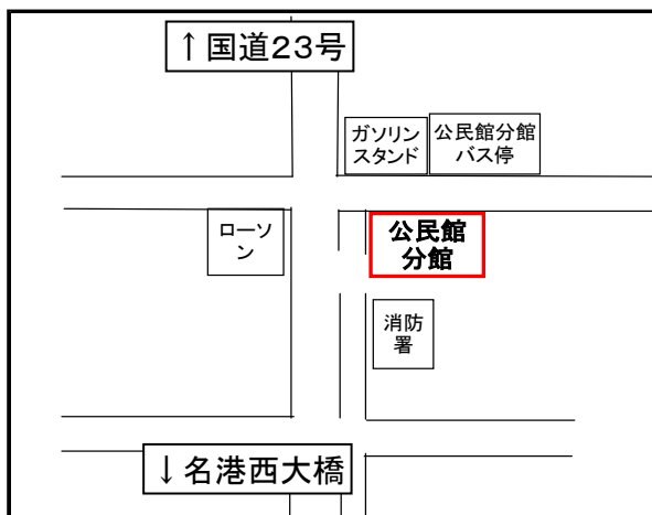
【公民館分館】 飛島村木場二丁目3番地