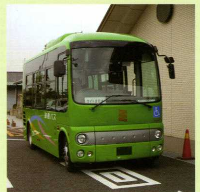
飛島コミュニティバス